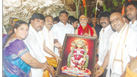
పర్యవేక్షకులు దాది జయవీర, దాది నిర్వహించారు. అనంతరం ఆలయం రివైజన్ పనులకు పరిశీలనలు చేశారు. (విశాఖ 29)