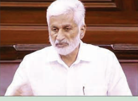
రాజస్థాన్లో జవాబిస్తూ ఈ అంశం ప్రస్తుతం కోర్టు విచారణలో ఉంది చెప్పారు. ఆంధ్రప్రదేశ్

న్యూఢిల్లీ: ఆంధ్రప్రదేశ్లో మూడు రాజధానుల వివాదంపై తలెత్తిన వివాదం ప్రస్తుతం కోర్టు విచారణలో ఉంది కేంద్ర హోం శాఖ సహాయ మంత్రి సిఐఎస్ఎం రాయ్ తెలిపారు. రాజధానుల నిర్ణయం తీసుకునే అధికారం ఆయా రాష్ట్రాలకు ఉంటుందని గతంలో కేంద్ర ప్రభుత్వం విస్పష్టంగా ప్రకటించిన విషయాన్ని ప్రస్తావించి మూడు రాజధానులు ఏర్పాటు చేయాలన్న రాష్ట్ర ప్రభుత్వ నిర్ణయాన్ని ఆంధ్రప్రదేశ్ హైకోర్టు కొట్టివేస్తూ ఇప్పటికీ తీర్పు నేపథ్యంలో దీనిపై కేంద్ర ప్రభుత్వం వైఖరి విమతి అని వైపిసిగ్నాటివ్ సభ్యులు బుధవారం రాజస్థాన్లో అడిగిన ప్రశ్నకు మంత్రి