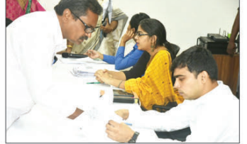
వికలాంగుల వద్దకు వచ్చి డి.ఆర్.టి. దరఖాస్తులు స్వీకరించారు. సోమవారం స్పందనకు 199 దరఖాస్తులు వచ్చాయి.