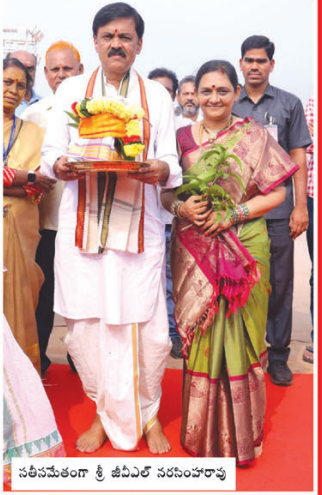
సతీసమేతంగా శ్రీ జీవీఎల్ నరసింహారావు

వేదికపై నుండి బీజేపీ ఎంపీ జీవీఎల్ నరసింహారావు మాట్లాడుతూ సాధారణంగా సంక్రాంతి మూడు రోజుల పండుగ అని, నగరంలో నివసించే ప్రజలు వివిధ గ్రామాలకు వెళ్లి బంధు మిత్రుల కలయికతో బాటు గ్రామీణ సంక్రాంతి వేడుకలను చూసి ఆనందిస్తారని, అయితే వివిధ కారణాలతో నగరంలో ఉండిపోయినవారంతా గ్రామీణ ప్రాంతపు సంక్రాంతి వాతావరణాన్ని చూసి అనుభూతి చెందేందుకు ఇక్కడ ఒక గ్రామాన్నే నిర్మించామని అనేక మంది గ్రామీణ కళాకారులను ఇక్కడికి రప్పించి నాలుగు రోజుల పాటు నగర ప్రజలకు కనువిందు చేస్తున్నామని అన్నారు. సంక్రాంతి పండుగ హిందువులకు ఎంతో ఆనందం పంచే పండుగ అని అందుకే ఇక్కడ సుమారు 50 మంది చేనేత కళాకారులతో చేనేత పత్ర దుకాణాలు, సంప్రదాయ వంటకాల దుకాణాలు ఇంకా అనేక రకాల బొమ్మలు వగైరాలు ఏర్పాటు