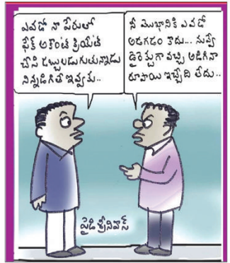
ఎవడో నా పేరులో ఫిక్స్ అకౌంట్ క్రియేట్ చేసి ట్రాన్సాక్షన్లు గుంటున్నాడు. నీ మోఖానికి ఎవడో లడగడం కెడు... సున్నె డైరెక్టుగా పప్పు అడిగినా రూపాయి ఇచ్చి కి లేదు..