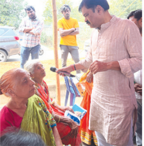
ప్రతి కోసం దేశాభివృద్ధి కోసం తెలియ చేశారు. ఈ కార్యక్రమంలో మరుసటి సరెంద్ర మోడీ దివ్యాంగుల కోసం పయో