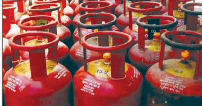
న్యూఢిల్లీ: ఇంకొద్దోజిల్లా ప్రత్యేక పార్లమెంట్ సమావేశాలు ఆరంభం కాబోతోన్నాయి. వచ్చే ఏడాది జరిగే సర్వేక్షన్లకు ఎల్పీజీ గ్యాస్ సమావేశాలు నాంది పలికే అవకాశాలు ఉన్నాయి. ఓటర్లను ఆకట్టుకునే దిశగా కేంద్రం ఈ సమావేశాల్లో కొన్ని కీలక నిర్ణయాలు, బిల్లులను ప్రవేశపెడుతుంది. దీని ప్రధానం జోరుగా సాగుతోంది. ఈ నెల 18 నుండి 22వ తేదీ వరకు ఆంధ్ర అయిదు రోజుల పాటు పార్లమెంట్ ఉత్తరం సభలను ప్రత్యేకంగా సమావేశం నిర్వహిస్తూ కేంద్ర మంత్రి ప్రవేశం కోటి ఇందిరల వెల్లడవుతాయి. ఆంధ్ర, లోక్సభకు ఒకేసారి ఎన్నికలను నిర్వహించడం లేదా, మహిళా రిజర్వేషన్ బిల్లును ప్రవేశపెట్టడం ఖాయంగా కనిపిస్తుంది.

ఈ పరిణామాల మధ్య కేంద్ర ప్రభుత్వం మరో సంచలన నిర్ణయాన్ని తీసుకుంది. ఎన్నికల జోరును మరింత పెంచేలా ఉండే నిర్ణయం. దేశవ్యాప్తంగా 75 లక్షల ఎల్పీజీ గ్యాస్ సెలిండర్ల కనెక్షన్లను ఉచితంగా మంజూరు చేయనుంది. వచ్చే మూడు సంవత్సరాల కాలంలో అంటే 2026 నాటికి ఈ 75 లక్షల ఉచిత గ్యాస్ కనెక్షన్ల జారీ ప్రక్రియను పూర్తి చేయనుంది. సంవత్సరానికి 25 లక్షలు చొప్పున గ్యాస్ కనెక్షన్లను మంజూరు చేస్తుంది. ప్రధానమంత్రి ఉత్తవ సభకు కింద వాటిని కేటాయిస్తుంది. ఈ మేరకు దేశ రాజధానిలో ప్రధానమంత్రి సరేంద్ర మోడి అధ్యక్షతన ఏర్పాటుైన కేంద్ర మంత్రివర్గ సమావేశంలో ఈ నిర్ణయం తీసుకుంది. కేంద్ర గ్యాస్ కనెక్షన్ కేసు 1,650 కోట్ల రూపాయల వ్యయం అవుతాయని అంచనా వేసింది. దీనికి (మినూ 2లో)