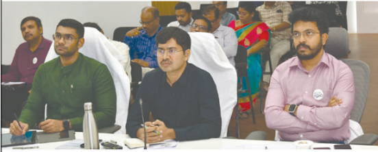
విశాఖపట్నం, (విశాఖ సమాచారము): ఆరోగ్య వ్యవస్థ నెల 15 నుండి ప్రభుత్వం నిర్వహించనున్న అంద్రప్రదేశ్ రాష్ట్రాన్ని తీర్చిదిద్దాలనే లక్ష్యంతో జగనన్న ఆరోగ్య సురక్ష కార్యక్రమాన్ని

విజయవంతం చేయాలని రాష్ట్ర ముఖ్యమంత్రి వైయస్ జగన్మోహన్ రెడ్డి అధికారులను ఆదేశించారు. బుడవారం ఉదయం తాడేపల్లి లోని సిఎం క్యాంపస్ కార్యాలయం నుండి అన్ని జిల్లాల కలెక్టర్లకు, జిల్లా కలెక్టర్లకు, మున్సిపల్ కమిషనర్లకు, వైద్య విభాగ శాఖ అధికారులతో ఆయన విడియో కాన్ఫరెన్స్ సమావేశం నిర్వహించి, ఈ కార్యక్రమం నిర్వహణకు శాఖల వారీగా చేస్తున్న ముందస్తు ఏర్పాట్లను సమీక్షించారు. ఈ సందర్భంగా ఆయన మాట్లాడుతూ రాష్ట్ర ప్రభుత్వం ఎంతో ప్రతిష్టాత్మకంగా నిర్వహించనున్న ఈ కార్యక్రమాన్ని సలబంధిత కార్య అధికారులు అందరూ సమన్వయంతో