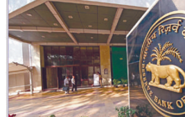
రిజర్వ్ బ్యాంక్ ఆఫ్ ఇండియా హెచ్చుతూ లోన్ కస్టమర్లకు పెద్ద ఉర్రుల ఇచ్చింది. ఇప్పుడు హెచ్చుతూ లోన్లకు తిరిగి చెల్లించిన తర్వాత మీరు మీ రిజర్వ్ పేసేసు 30 రోజులలోపు తిరిగి పొందుతారు. ఈ మేరకు రిజర్వ్ బ్యాంక్ ఆఫ్ ఇండియా (ఆర్బీఐ) బ్యాంకులకు ఆదేశాలు జారీ చేసింది. 30 రోజుల లోపు బ్యాంకు రిజర్వ్ పేసేసును ఖాతాదారులకు తిరిగి ఇవ్వకపోతే, బ్యాంకు ప్రతిరోజు రూ. 5000 ఇచ్చునట్లు బరిమానా చెల్లించాలి ఉంటుంది ఆర్బీఐ హెచ్చింది. రిజర్వ్ బ్యాంక్ ఆఫ్ ఇండియా ఆర్బీఐ పత్రాలను తిరిగి ఇవ్వడానికి నిబంధనలను

జారీ చేయడం ద్వారా బ్యాంకులకు స్పష్టం చేసింది. ఇప్పుడు రెండు రుణం వార్షికం నా రిజర్వ్ పేసేసు కోసం ప్రజలకు తెలియకూడదు బ్యాంకుల ప్రత్యేక కారణాల అనేక సార్లు తిరిగి తెలియదయ్యి వచ్చింది. ప్రత్యేక బ్యాంకు శాఖలో ఉండాలి. రిజర్వ్ బ్యాంక్ నిర్ణయంతో గ్రూపు రుణం చెల్లించిన ఖాతాదారులకు ఎంతో ఉపశమనం కలుగుతుంది. వారి ఆర్బీఐ పత్రాల 30 రోజులలోపు రుణం తీసుకున్నా శాఖలో అందుబాటులో ఉండాలి. కస్టమర్లకు టాకెన్లలో ఆర్బీఐ 30 రోజుల కాలపరమితి ని నిర్ణయించింది. బ్యాంకు సస్టైన్బిల్టీ భేదీ చయోరీ గ్రూపు రుణ ఖాతాదారుడి ఆర్బీఐ పత్రాల పోగొట్టుకున్నా లేదా పత్రాలు పాతపాతాలు బ్యాంకులో బాధ్యత వహించాలి ఉంటుంది. బ్యాంకులకు ఆదేశాలు (మినూ 2లో)