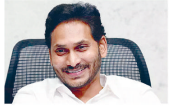
అన్యుల నుండి ఒక సైనికుని ద్వారా సైతం ఈ హెల్త్ క్యాంపులకు హాజరవుతారు. వైద్య శిబిరం వద్ద 105 రకాల మందులు, అన్ని రకాల వైద్య పరికరాలు అందుబాటులో ఉంచడానికి జగన్ ప్రభుత్వం ఏర్పాట్లు పూర్తి చేసింది. ప్రజల

అమరావతి: ముఖ్యమంత్రి వైయస్ జగన్మోహన్ రెడ్డి సారథ్యంలో వైఎస్ఆర్ కాంగ్రెస్ పార్టీ ప్రభుత్వం మరో పథకానికి శ్రీకారం చుట్టింది. జగనన్న ఆరోగ్య సురక్ష పేరుతో ఈ నెల 30వ తేదీ నుండి ఈ పథకాన్ని ప్రారంభించనుంది. రాష్ట్రంలోని పేదలందరికీ కుటుంబ సంక్షేమం, ఆరోగ్య భరోసా కల్పించడంలో భాగంగా ఈ పథకాన్ని చేపట్టనుంది. వ్యాధిగ్రామీ పలంబిల్లు, ఎఎసిలూ రాష్ట్రంలోని ప్రతి ఇంటికీ వెళ్లారు. ప్రజల ఆరోగ్య అవసరాలను గుర్తిస్తారు. ఆరోగ్య సరఫరాను సమన్వయం ఉన్న వారి కోసం గ్రామాలు, వ్యాధిగ్రామీ హెల్త్ క్యాంపులను నిర్వహిస్తారు. వైద్య సేవలను అందిస్తారు. డిగ్రీకాలిగ్ అసోసియేషన్ గుర్తిన వారికి సంబంధిత కార్యక్రమాలను నిర్వహిస్తారు. ఈ వైద్య శిబిరాన్ని కూడా ఇద్దరు సైనికులు ద్వారా సంబంధిత మండలంలోని ప్రాథమిక ఆరోగ్య కేంద్రంలో పనిచేసే ఇద్దరు డాక్టర్ల వ్యవస్థలతో కొనసాగుతాయి. రోగులకు అభ్యుదయ వ్యవస్థ అందిస్తారు. ఆరోగ్య శిబిరాలను