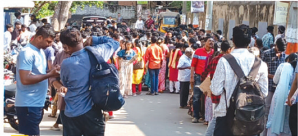
విశాఖలో ఒక వర్కేజీ కేంద్రం వద్ద..

అమరావతి/విశాఖపట్నం (విశాఖ సమాచారం):- ఏప్రిల్ వ్యాపారం పరీక్షలకు ప్రారంభం చేయబడింది. సామాన్య పరీక్షలు ఏప్రిల్ 1 వరకు అవి కొనసాగుతున్నాయి. సుమారు 6.50లక్షల మంది విద్యార్థులు పాల్గొంటారు. ఈసారి రాష్ట్రంలో విద్యార్థులతోపాటే సాధారణ విద్యార్థులకు పరీక్షలు నిర్వహిస్తున్నారు. ప్రత్యేకతలను చూడకుండా