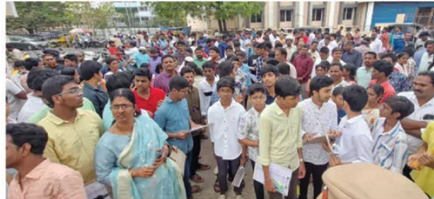
విజయవాడలో నలుమడుగు సహకార వర్కేజీ కేంద్రం వద్ద..

అమరావతి/విశాఖపట్నం (విశాఖ సమాచారం):- ఏప్రిల్ వ్యాపారం పరీక్షలకు ప్రారంభం చేయబడింది. సామాన్య పరీక్షలు ఏప్రిల్ 1 వరకు అవి కొనసాగుతున్నాయి. సుమారు 6.50లక్షల మంది విద్యార్థులు పాల్గొంటారు. ఈసారి రాష్ట్రంలో విద్యార్థులతోపాటే సాధారణ విద్యార్థులకు పరీక్షలు నిర్వహిస్తున్నారు. ప్రత్యేకతలను చూడకుండా