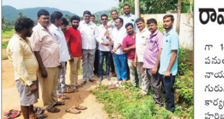
పరవాడ, (విశాఖ సమాచారము): పరవాడ మండలం రావాడ పంచాయతీ మోటారువాని పాఠశాల విజయనగరం జిల్లాలో 12 మండలాలలో 201 గ్రామాలకు చెందిన 78,564 ఎకరాలు, క్రీకాళం