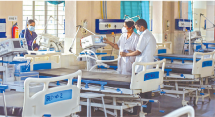
విశాఖపట్నం, (విశాఖ సమాచారము): చెందుతోంది. అయితే ఇప్పటివరకూ ఏపి సహా వలె రాష్ట్రంలో కోవిడ్ వైరస్ రాష్ట్రంలో కోవిడ్ మరణాలు మాత్రం వ్యాప్తి చెందుతుంది. ఒమిక్రాన్ ఉపవంశ వైరస్ కేసు 1 వైరస్ వేగంగా వ్యాప్తి వైజాగ్ లోని కింగ్ జార్జ్ ఆస్పత్రిలో 1.