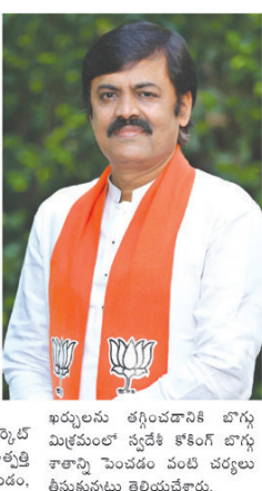
ఖయ్యలను తగ్గించడానికి బొగ్గు మిగిలిన స్టేట్ కోలింగ్ బొగ్గు శాస్త్రాన్ని పెంచడం వంటి చర్యలు తీసుకున్నట్లు తెలియచేశారు.

చెల్లింపులు తరువాతి నెల మొదటి వారంలో చేయబడతాయని మంత్రి చెప్పారు. ఎంపీ జీవీఎల్ ఆడిగ్ మిగిలిన ప్రశ్నలకు సమాధానంగా ఉక్కు మంత్రి కేంద్ర ఉక్కు మంత్రిత్వ శాఖ రిజిస్ట్రేషన్ మార్గం ద్వారా బిల్ ట్రాక్ చేయాలని అడిగారు. విశాఖ స్ట్రీట్ షాంట్ ఉద్యోగులకు జిలాల్ చెల్లింపుల అలస్యంపై కేంద్ర ఉక్కు శాఖ మంత్రికి పలు ప్రశ్నలు పంపించారు. విశాఖ స్ట్రీట్ షాంట్ ఉద్యోగులకు జిలాల్ చెల్లింపుల అలస్యంపై కేంద్ర ఉక్కు శాఖ మంత్రికి పలు ప్రశ్నలు పంపించారు. విశాఖ స్ట్రీట్ షాంట్ ఉద్యోగులకు జిలాల్ చెల్లింపుల అలస్యంపై కేంద్ర ఉక్కు శాఖ మంత్రికి పలు ప్రశ్నలు పంపించారు.