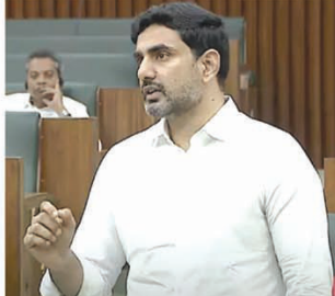
తప్పనిసరిగా ఇంటిలో ఎంతమంది చదువుకునే బిడ్డలు ఉంటే అంతమందికీ పథకాన్ని వసతిపెట్టమని మంత్రి నారా లోకేశ్ స్పష్టం చేశారు.

శాసనసభలో మంత్రి నారా లోకేశ్ స్పష్టికరణ అమరావతి, (విశాఖ సమాచారం):- తల్లికి వందనం పథకాన్ని ప్రభుత్వం ప్రతిష్టాత్మకంగా ప్రవేశపెడుతోందని రాష్ట్ర విద్య, జి.పి, ఎ.ఎ.కె.సి. కాలేజీలు మంత్రి నారా లోకేశ్ పేర్కొన్నారు. తానసభలో వైసీపీ సభ్యులు వందనం ప్రశ్నకు మంత్రి లోకేశ్ సమాధానమిచ్చాడు. తల్లికి వందనం పథకానికి సంబంధించిన గైడ్ లైన్స్ లోకేశ్ ఇచ్చారు. బిడ్డలలో యా.9407 కోట్లు ఈ పథకానికి కేటాయింబారు. గత ప్రభుత్వంలో వారు సంవత్సరానికి 5,540 కోట్లు కేటాయింబారు, గతంలో పోలిస్తే ఇది 50శాతం అధికం. ప్రభుత్వం ముందుకు బాబు సూచన- 6 అనే కార్యక్రమాన్ని ప్రజల్లోకి తీసుకొచ్చారు. ప్రజల ఆకాంక్షలకు అనుగుణంగా తల్లికి వందనం పథకాన్ని అనాదిగా చంద్రబాబుగారు ప్రకటించారు. భారతదేశంలో రిస్క్స్ మెంట్ రేట్ లో తమగనారు తల్లక స్థానంలో ఎన్నికీ ఉంది. మేనలలో