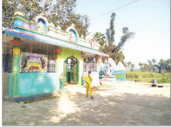
అలయం లో ప్రారంభించారు .ఈ కలకాలన్ని కూడా పూజా కార్యక్రమం ఆనందం మహిళలు చిన్నారులు,మాలదారణ