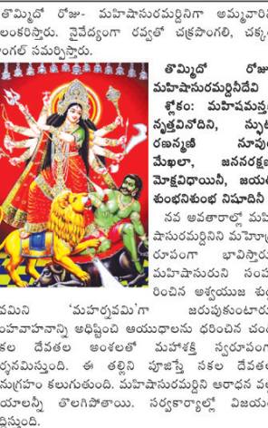
తొమ్మిది రూపాల మహావైశువర్పిని దేవీ శక్తి: మహావైశువర్పి సృష్టిచేసినది, ముగ్గురు రణసైని నూపురు మోహల, జననరక్షణ మార్కెటాయిని, జయతి కుంభవతిని సమిపి...