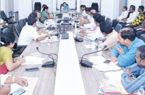
నియంత్రణ మండలి ప్రతినిధులు అభ్యంతరాలు వివరించే జరుగుతుంది. టారిఫ్ పైకి కు సంబంధించిన సూచనలు విశాఖపట్నం నుండి వీడియో కాన్ఫరెన్స్ ద్వారా

కాకినాడ, (విశాఖ సమాచారం): ఆంధ్రప్రదేశ్ విద్యుత్ నియంత్రణ మండలి ఆధ్వర్యంలో 2023-24 ఆర్థిక సంవత్సరానికి వార్షిక ఆదాయ అవసరాలు, రైల్వే ధరలపై బహిరంగ ప్రజాభిప్రాయ సేకరణను స్థానిక సూపరింటెండెంట్ ఇంజనీర్, ఆవరేషన్, విద్యుత్ భవన్, రాజమహేంద్రవరం వారి కార్యాలయం మరియు ఎగ్జిక్యూటివ్ ఇంజనీర్, ఆవరేషన్, రాజమహేంద్రవరం, కాకినాడ, జగన్మోహన్, రామచంద్రపురం, ఆముచాపురం, మరియు రంపచోడవరం కార్యాలయములలో ఈ నెల 19, 20 మరియు 21 తేదీల్లో నిర్వహించడం జరుగుతుంది. వీడియో కాన్ఫరెన్స్ ద్వారా ఈ ప్రజాభిప్రాయ సేకరణ కార్యక్రమం జరుగుతుంది. ముందు రోజుల సాటు జరిగే ఈ ప్రజాభిప్రాయ సేకరణలో విద్యుత్