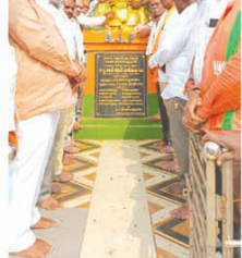
అసకాపల్లి అసెంబ్లీ కన్వెన్షన్ బోర్డు సభ్యులు వాజ్పేయి జయంతి సుపరిపాలన దినోత్సవం సందర్భంగా అసకాపల్లి రోడ్డులో గల వాజ్ పే యి ఎగ్జిషం వద్ద జరిగింది.