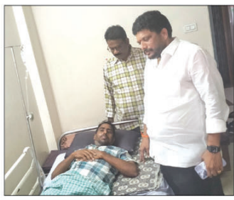
కాకనాడ, (విశాఖ సమాచారము): రోడ్డు ప్రమాదంలో గాయపడి కాలుకి శ్రీ చికిత్స పొందుతున్న పాలిటెక్స్ కార్మికులు సన్న శ్రీచికిత్స కార్యకర్తల జిల్లా డిడికి అర్పణలు చేస్తున్నారు. సుమారు 19న అనకాపల్లి వస్తున్న సందర్భంగా చంద్రబాబు