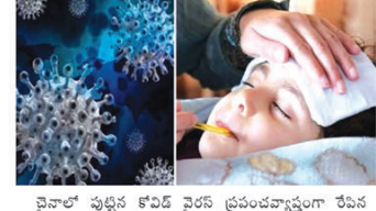
చైనాలో పుట్టిన కోవిడ్ వైరస్ ప్రపంచవ్యాప్తంగా వేసిన కల్లోలం మర్చిపోకముందే ఇప్పుడు మరోసారి గ్రామ్స్ దేశం నుంచి మరొక క్యాన్ సందంభిత