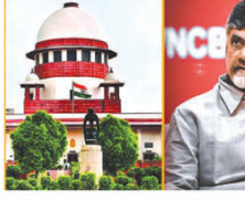
మరో సారి ఓటు కు నోటు కేసు తెర వైకి వచ్చింది. ఓటుకు నోటు కేసులో చంద్ర