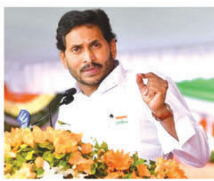
అందరినూ, మౌలిక సదుపాయాల అభివృద్ధి రంగంలో ఏర్పాటు చేయనున్న 17 ప్రాజెక్టుల్లో గుంటూరు, హిందూపూర్, మచిలీపట్నంలో రూ.670 కోట్లలో పూర్తియిన ప్రాజెక్టులను ప్రారంభించారు. ఏలూరు జిల్లాలో స్ట్రాక్చర్ ప్రాజెక్టు గో యానటి, విజయనగరం, కర్నూలు

ఏపీలో ఎన్నికల వేళ సీఎం జగన్ పూజాత్మక ఆదేశాలు చేస్తున్నారు. పాలనా, పార్టీ పరంగా కీలక నిర్ణయాలు తీసుకుంటున్నారు. ఇప్పటికే పార్టీ శ్రేణులను ప్రజలతో మమేకం అయ్యేలా ప్రణాళికలు అమలు చేస్తున్న ముఖ్యమంత్రి ఇప్పుడు పెట్టుబడులు - ఉపాధి కల్పన పైన పోకడ చేశారు. కొత్త పరిశ్రమలను పరంగా శ్రమకట్టిన చేశారు. ఏపీలో పెట్టుబడులు - ఉపాధి కల్పన పైన స్పష్టత ఇచ్చారు. ఒక్క పోన్ కాలే దూరంలో అందుబాటులో ఉంటున్న ఇన్ఫ్రాస్ట్రక్చర్ హామీ ఇచ్చారు. శ్రమకట్టిన : ముఖ్యమంత్రి జగన్ కొత్త పరిశ్రమలకు శ్రమకట్టిన చేశారు. ఏపీ ద్వారా 21,079 మందికి ఉపాధి