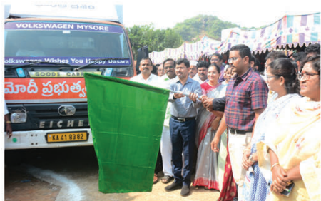
జిల్లాలోని 4 రూరల్ మండలాల్లో గల రెండు మండలులకు చెందిన 40 గ్రామ మండలులలో లోబాకు లోబాకు పాటు

విశాఖపట్టణం, (విశాఖ సమాచారము): కేంద్ర ప్రభుత్వం అమలు చేస్తున్న పథకాల గురించి ప్రజల్లో విస్తృత స్థాయిలో అవగాహన కల్పించే దిశగా భారత్ ప్రభుత్వం ప్రతిష్టాత్మకంగా నిర్వహిస్తున్న కార్యక్రమం వికెసెన్ట్ భారత్ సెంటర్స్ యాత్ర అనే జిల్లా కలెక్టర్ డా.వి.మల్లారావు తెలిపారు. ముద్రాపాత విశాఖపట్టణం జిల్లా ఆసన దపురం ఎంపీడిఓ కార్యాలయ సమావేశ మందిరంలో ఏర్పాటుచేసిన వికెసెన్ట్ భారత్ సెంటర్స్ యాత్ర ప్రారంభోత్సవ కార్యక్రమానికి జిల్లా కలెక్టర్ ముఖ్య అతిథిగా పాల్గొని కీర్తి ప్రజ్వలన అందించారు.