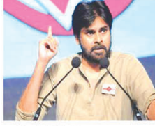
ఏపీలో టీడీపీలో పాపులర్ ప్రకటన తర్వాత తమ పార్టీ శ్రేణుల్ని ఎన్నికలకు సన్నద్ధం చేసే

పనిలో బిజిగా ఉన్న జనసేనకు తెలంగాణ ఎన్నికల రూపంలో ట్రేక్ పడింది. అదేపక్ష పక్షం కళ్యాణ్ తెలంగాణ ప్రచారం పూర్తిచేస్తే బిజిగా ఉండటంతో టీడీపీలో సమస్యలు చేటిల తర్వాత ఏపీలో జనసేన కార్యకలాపాలకు లాభాల్లోకి ట్రేక్ పడనట్లు యింది. ఇప్పుడు రేపటిలో తెలంగాణ ఎన్నికల పోలింగ్ కూడా ముగియనుం డటంతో డిసెంబర్ 1 నుంచి ఏపీపై పూర్తి స్థాయి పోకడ పెట్టేదంటూ నిర్ణయపుతోంది.