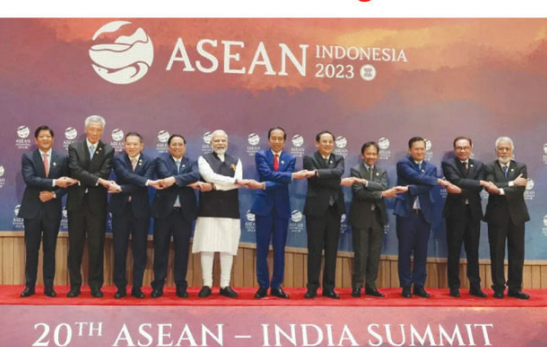
రెంజ్రోవాల్ ఇండియాలో జరిగిన 20వ సదస్సు ఉన్నా, షెడ్యూల్‌లోని అత్యంత బిజినెస్ ఉంచుకుంటూ.. ప్రధానమంత్రి నరేంద్ర మోదీ మాత్రం తన గురువారం ఇండోనేసియాలోని జకార్తాలో

పర్యటిస్తున్నారు. ఆక్రమ ఇవాళ జరిగి 20వ ఆసియన్- ఇండియా సదస్సులో పాల్గొన్నారు. ఇండియా అమలుచేస్తున్న యాక్స్ ఈస్ట్ పాలిసి ఆసియన్ గ్రూప్.. మూల స్తంభం లాంటిది అని మోదీ అన్నారు. ఇండో-పసిఫిక్ డేజిలైజ్డ్ ఆసియన్ గ్రూప్ అభివృద్ధిలో భాగంగా భారత్ సమర్థిస్తున్న ప్రధాన మోదీ అన్నారు. "మన భాగస్వామ్యం 4వ దశాబ్దంలోకి ప్రవేశించింది. ఇండియా యొక్క ఇండో-పసిఫిక్ ఇన్వెస్ట్‌మెంట్ అసియన్ కీలక పాత్ర పోషిస్తుంది" అని మోదీ తెలిపారు. ఆసియన్ గ్రూప్.. అభివృద్ధికి కీలక కేంద్రంగా ఉందని, ప్రపంచ అభివృద్ధిలో ప్రధాన పాత్ర పోషిస్తుందని మోదీ తెలిపారు. "మన పరస్పర సహకారంలో స్థిరమైన వృద్ధి ఉంది. ప్రపంచవ్యాప్తంగా ఆసియన్ పరిస్థితులు ఉన్నా మనం కలిసి ఆసియన్ మోడల్" అని మోదీ అన్నారు. ప్రధానమంత్రి నరేంద్ర మోదీ, ఇండోనేసియా రాజధాని జకార్తాకు గురువారం ఉదయం