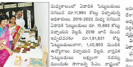
మధ్యకాలంలో ఏడాదికి పెట్టుబడులు

సంపద్రణ, ఉగ్రవాదం, భౌగోళిక రాజకీయ ఉద్రిక్తతలను మనస్సు ఓ ఇబ్బంది కరమైన సంవత్సరాల్లో చాలి వచ్చాయి. మూలోవంతు జనాభా మన డేకాల్ నే నివసించింది. మనందరి స్వరం ఒకే పదంగా ఉండాలి. తద్వారా డేకాల్ ను వాటి పద్ధతుల్లో మార్పులు వచ్చాయి. అభివృద్ధి