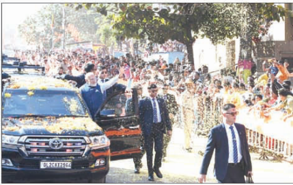
దిల్లీ ప్రపంచం మొత్తం సంక్రొభంలో

స్వచ్ఛంగా తెలుస్తోంది. ఈ అన్నిరక వింతకాలం ఉంటుందనే విషయం అందరూ వేయడం కష్టమేననే ప్రధానమంత్రి నరేంద్ర మోడీ పేర్కొన్నారు. ఆహారం, ఇంధనం, ఎరువుల ధరలు పెరగడంలో పాటు కొని డి కారణంగా ఆర్థిక వ్యవస్థపై పడిన ప్రభావం ఇంకా కొనసాగుతోందన్నారు. వాతావరణ మార్పుల కారణంగా సంభవిస్తున్న ప్రకృతి వైపరీతాలపై ప్రధాని మోడీ ఆందోళన వ్యక్తం చేశారు. 'వాయిస్ ఆఫ్ ది గ్లోబల్ సాత్ సమిట్'ను వచ్చే ఏడాది ప్రారంభించిన ఆయన.. 21వ శతాబ్దంలో ప్రపంచ వృద్ధి ఈ డేకాల్ నుంచే జరుగుతుందని ఆశాభావం వ్యక్తం చేశారు. 'కొత్త శక్తి, సరికొత్త ఆలోచన' ఆరంభమైన ఈ సూత్రం సంవత్సరంలో మనం సమావేశమవుతున్నాం. యుద్ధం, ప్రపంచం సంక్రొభ స్థితిలో ఉన్నట్లు