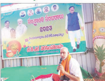
విశాఖపట్నం, (విశాఖ సమాచారం):