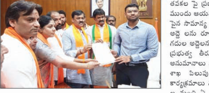
విశాఖపట్నం, (విశాఖ సమాచారం):

తవల పై ప్రభుత్వం విచారణ జరపాలని కోరారు. అంతకు ముందు ఆయన మీడియాలో మాట్లాడుతూ, తిరుమల కొండ పైన సామాజిక తత్వలు విడిచి చేసే నారాయణం లో గదుల అడ్డంకులు రూ.150 మంది ఏకంగా రూ.1500 కి, రూ.750 గదుల అడ్డంకులు రూ.2,200 కి పెంచడం దారుణ మన్నారు. ప్రభుత్వం తీరు హిందూ ధర్మం పైన వేటు వేసేలా అసమానమైన వ్యక్తం అవుతున్నాయని ఆన్నారు. బీజేపీ రాష్ట్ర శాఖ నెలవారీ మేరకు అన్ని జిల్లాల్లోనూ ఆందోళన కార్యక్రమాలను నిర్వహిస్తున్నారని తెలిపారు. అన్నీ మతస్థులు సీఎం ఏ ఆదాయం రాకున్నా సరే ప్రభుత్వం పాపం, ఇమామ్ లకు ఆర్థిక సాయం చేస్తున్నారని, టీడీపీ అడ్డంకులు తగ్గించడం పోతే రాష్ట్రంలో ఆందోళన ఉధృతం చేస్తామని హెచ్చరించారు. యువ మో రాష్ట్ర అధ్యక్షులు సురేంద్ర మోహన్ మాట్లాడుతూ, తిరుమల వెయ్యి కోట్ల మందికి కల్యాణమేననే తరువాత చంద్ర బాబు కి ఏ గతి పట్టింది గుర్తు చేసుకోవాలి అన్నారు. అలాగే దినంతో ముఖ్యమంత్రి వైఎస్ రాజశేఖరరెడ్డి కూడా తిరుమలను పిచ్చి చూపుతూనే ఉన్నారని ఆయన ఆందోళన కి తెలుసు అన్నారు. సీఎం జగన్ కూడా అదే దారిలో పనిచేస్తున్నారని ఆది అన్నారు. బీజేపీ విశాఖ పార్లమెంట్ జిల్లా అధ్యక్షులు శ్రీ ఎం రవీంద్ర మాట్లాడుతూ, ప్రభుత్వం పెంచిన అడ్డంకులు