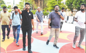
విశాఖపట్నం, (విశాఖ సమాచారం): మహా ప్రాంతాన్ని ఆకర్షణీయంగా

సి.ఎం.సాయికాంత్ నగరంలో దక్షిణంలాండ్, బీచ్ లోని స్విమ్మింగ్ పూల్, ఎం.వి.సి, హనుమంతవాక జంక్షన్, హెచ్.బి. కాలనీ, ఎస్.వి.ఎస్ కాలనీ, మూలశివ నగర్, మూలశివ హిల్స్ తదితర ప్రాంతాలను సందర్శించారు. ఈ సందర్భంగా కమిషనర్ నగరంలో దక్షిణంలాండ్