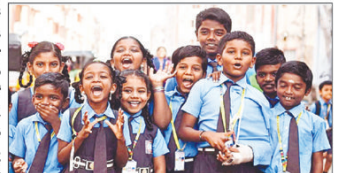
వ్యవసాయం, మల్లెపల్లి తెలంగాణలో నగర జీవనం జరుగుతుండటంతో విధిపడి గత నెలలో బందీ నిర్వహించిన

నిలుపువీడి చేస్తున్నారు. కేజీ నుంచి పీఠ వరకు ఫీజులు, పుస్తకాలు, యూనిఫాం, డాన్షింగ్, కల్చరల్ యాక్టివిటీస్.. అంటూ రకరకాల ఫీజుల పేర్లతో తగ్గించడం చేస్తున్నారు. ప్రభుత్వం జారీ చేసిన జీవో నం.1 యుద్ధేచ్ఛగా ఉల్లంఘిస్తున్నారు. ప్రైవేటు విద్యార్థుల ఫీజుల దండాలను విద్యార్థులు భరించడం అసాధ్యం అని ఆరోపణలు సైతం చేస్తున్నారు. ఒకరిద్దరు విద్యార్థులకు టాన్ మార్కులపై పెద్ద ప్రకటనలిస్తూ సామాన్యులకు ప్రభుత్వ పాఠశాలలపై అవసరమైన కలిగి