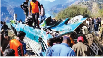
శ్రీనగరం: జమ్మూ కాశ్మీర్లో విషాదకర సంఘటన చోటు చేసుకుంది. ఓ రోడ్డు ప్రమాదంలో 36 మంది బాధితులను చికిత్స చేసినట్లు ప్రమాదం

ప్రయాణికులు దుర్ఘటన పాలయ్యారు. 19 మంది తీవ్రంగా గాయపడ్డారు. వారిలో ఆరుమంది పరిస్థితి అత్యంత విషమంగా ఉంది. పరితంగా మృత్యుల సంఖ్య మరింత పెరిగే అవకాశం ఉన్నట్లు తెలుస్తోంది. గాయపడ్డ వారిని సమీప వైద్య చికిత్స తరలిస్తారు. అత్యవసర వైద్య చికిత్సను అందిస్తారు. జమ్మూ కాశ్మీర్ దోహా జిల్లాలోని అస్సోర్ సమీపంలో ఈ దుర్ఘటన చోటు చేసుకుంది. సుమారు 55 మంది ప్రయాణికులతో మరలక పెరిగి ప్రమాదం